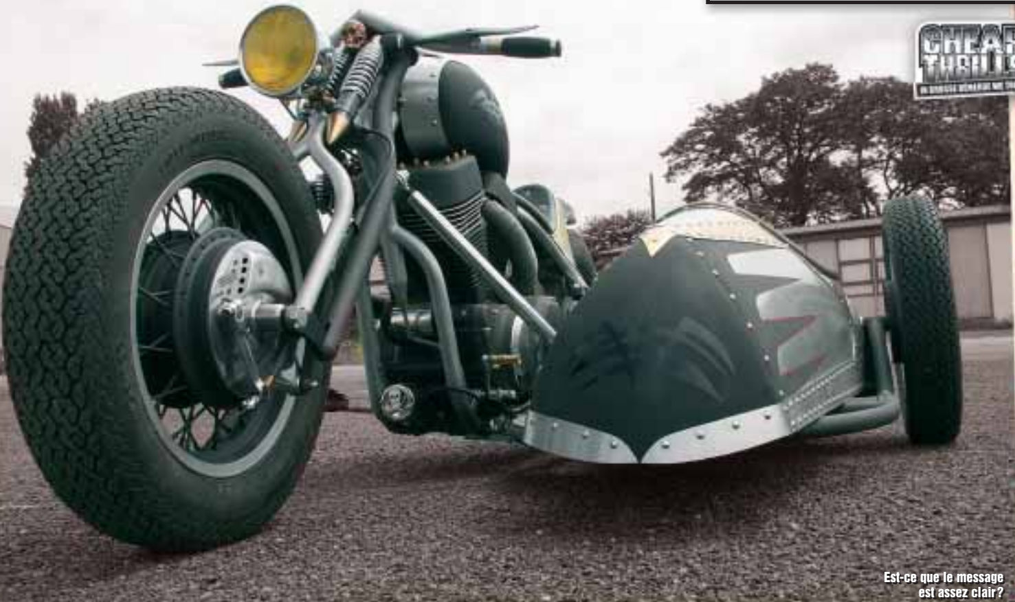
Est-ce que le message est assez clair?

Un grand merci à l'Association Alençonnaise des Avions Anciens pour avoir mis à notre disposition leurs avions, et pas les plus petits. Celui qui m'intéressait particulièrement était le Bombardier Dassault type Flamant MD311. L'allure de cet avion tout en tôle (entièrement restauré par leur soin) collait parfaitement à l'esthétique du Wild Side. Grâce à eux j'ai pu avoir le bon background et réaliser la mise en scène souhaitée. http://perso.wanadoo.fr/a3a.ava